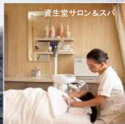
資生堂サロン&スパ

お申し込みとお問い合わせはJTB Global Business France まで http://www.jtb-uni.com | e-mail: japandesk@jtb.fr tel: 01 53 45 93 34(日本語専用)